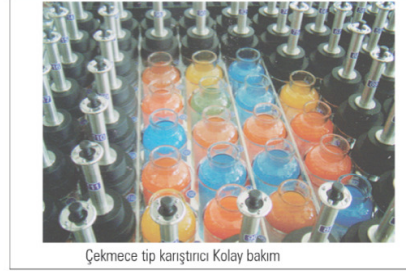
Çekmece tip karıştırıcı Kolay bakım

Bağımsız enjektör tasarımı sayesinde kendi enjektörü olan her bir şişe de geleneksel ara yıkama, enjektör kurutma döngüsü arasında çeşitli solüsyon kazara kontaminasyon riski olmamaktadır, dolayısıyla tek enjektör sistemi ile kıyasla çalışma etkinliği artmaktadır ve enjektörü temizlemek için herhangi bir zaman kaybı olmamaktadır.