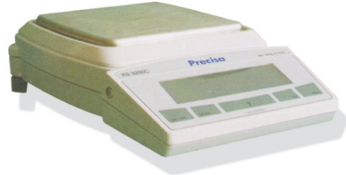
■ Hassas Terazi (XB 3200C)