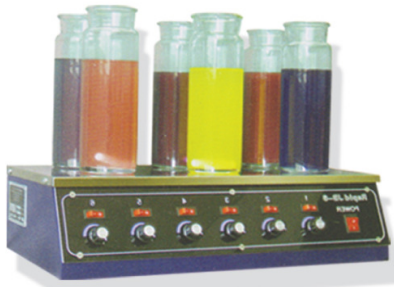
■ Manyetik Karıştırıcı ( JB-6 )